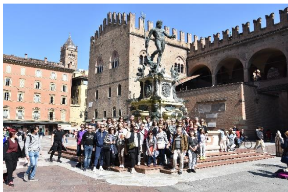
Bologna, Italija