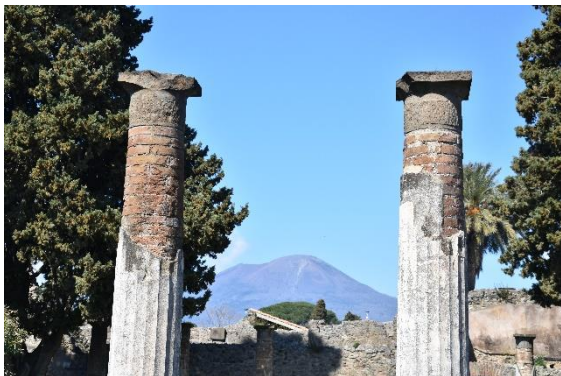
Pompeji, Italija