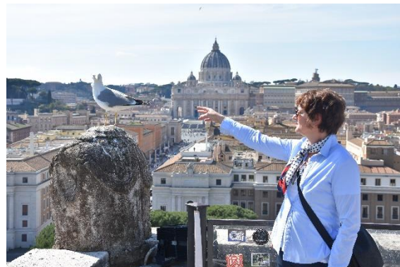
Pogled na Vatikan s Anđeoske tvrđave, Rim

krhotine keramike ili pak samo pogled na Vezuv i krajolik Napuljskog zaljeva podsjetnik su i opomena koliko je život sićušan i može biti kratak. Živjeti i umrijeti upisano nam je u genima. Svako putovanje ostavlja tragove, u nama i iza nas, a ovo putovanje je svakako jedno od njih.