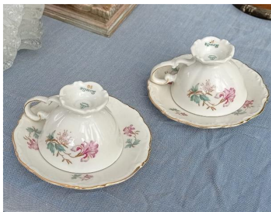
Orvieto, Italija